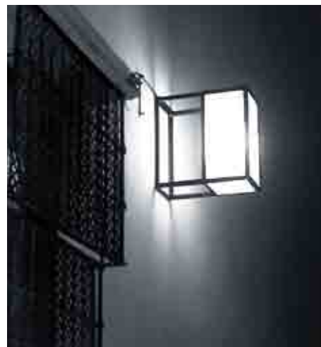
Las nuevas farolas responden al deseo de un diseño discreto y elemental.

La propuesta física no es nueva: el uso de las paredes como vehículo de mensajes es tan antiguo como la propia ciudad. Sin necesidad de remontarse a los sabidos casos de las inscripciones en las calles de la época romana, son notables las frases, iniciales, vítores, etc que ilustran los muros de muchas universidades (Baeza, Salamanca,...) y en tiempos más próximos, ideologías sin otros cauces para la expresión, vieron en la brocha y en las paredes las mejores herramientas para la convicción. Luego, desde los setenta del pasado siglo, los grupos urbanos más o menos contraculturales descubrieron el enorme potencial expresivo del espray. Así las ciudades se llenaron de mensajes que constituyeron (y aún hoy) una inequívoca seña de identidad de