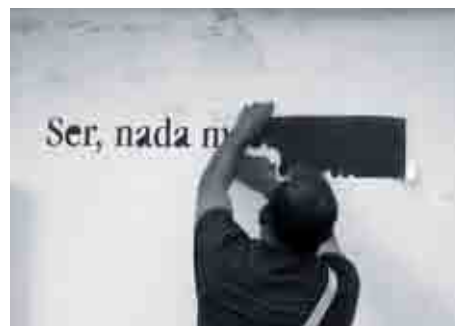
Para realizar los textos murales se usaron plantillas de vinilo.