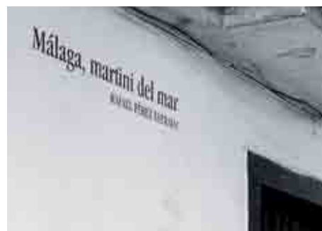
Frases universales llenan la paredes del sector.