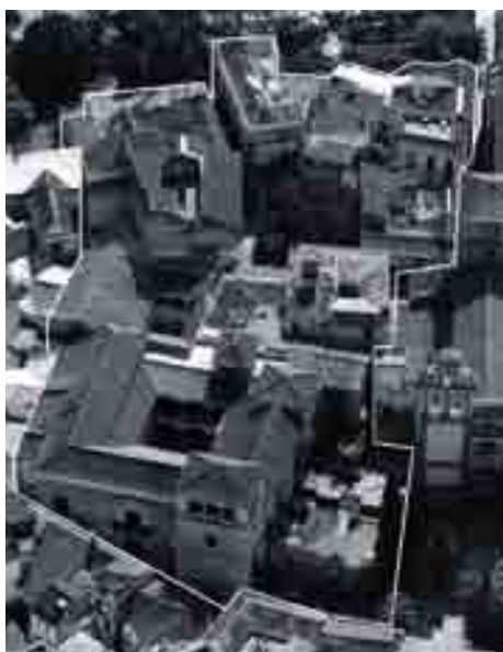
El proyecto final integró edificaciones colindantes al palacio.

dos de madera han contribuido a mantener a lo largo del tiempo. La entrada se realiza por la misma puerta principal aunque se modifica la posición de la escalera para conseguir un espacio de acogida más amplio, cambiándose la entrada directa al patio por una en recodo, solución que tiene apoyaturas en la tradición andaluza.