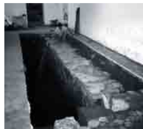
Dos años duraron las excavaciones realizadas en el Palacio de Buenavista.

APROVECHANDO UN SOLAR VACÍO EN EL QUE DESDE HACE TIEMPO HA CRECIDO UNA HERMOSA HIGUERA SE CREA UNA PLAZA QUE SE CONVIERTE EN CENTRO DE TODA LA ACTIVIDAD CULTURAL DEL MUSEO