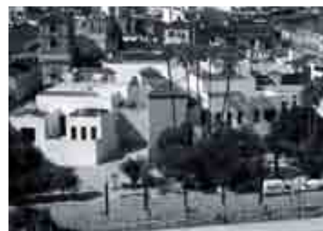
Antes y después de la intervención.