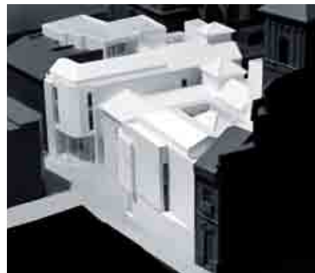
Maqueta del futuro museo.