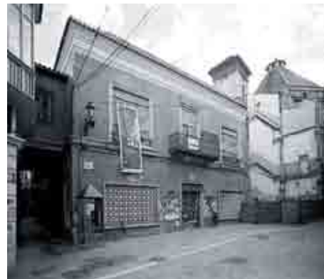
El Palacio de Villalón antes de su restauración.

El proyecto de rehabilitación del Palacio de Villalón y su entorno apuesta por la recuperación y la puesta en valor de esta edificación del s. XVI, proceso que ya se inició con la restauración de sus armaduras y cubiertas, recuperando su traza histórica de acuerdo con los análisis y estudios realizados. Para ello, se vuelve a formalizar el patio completando el frente oeste desaparecido; se recupera la presencia de arcadas y columnas de mármol ocultas o desaparecidas, según los casos; se rehace la galería de planta primera de acuerdo con los vestigios encontrados y siguiendo el modelo de edificaciones similares de